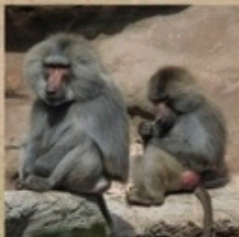
le babouin hamadryas