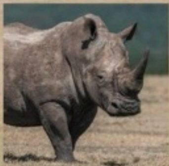
le rhinocéros blanc

UNE INCROYABLE VARIÉTÉ D'ESPÈCES À DÉCOUVRIR !